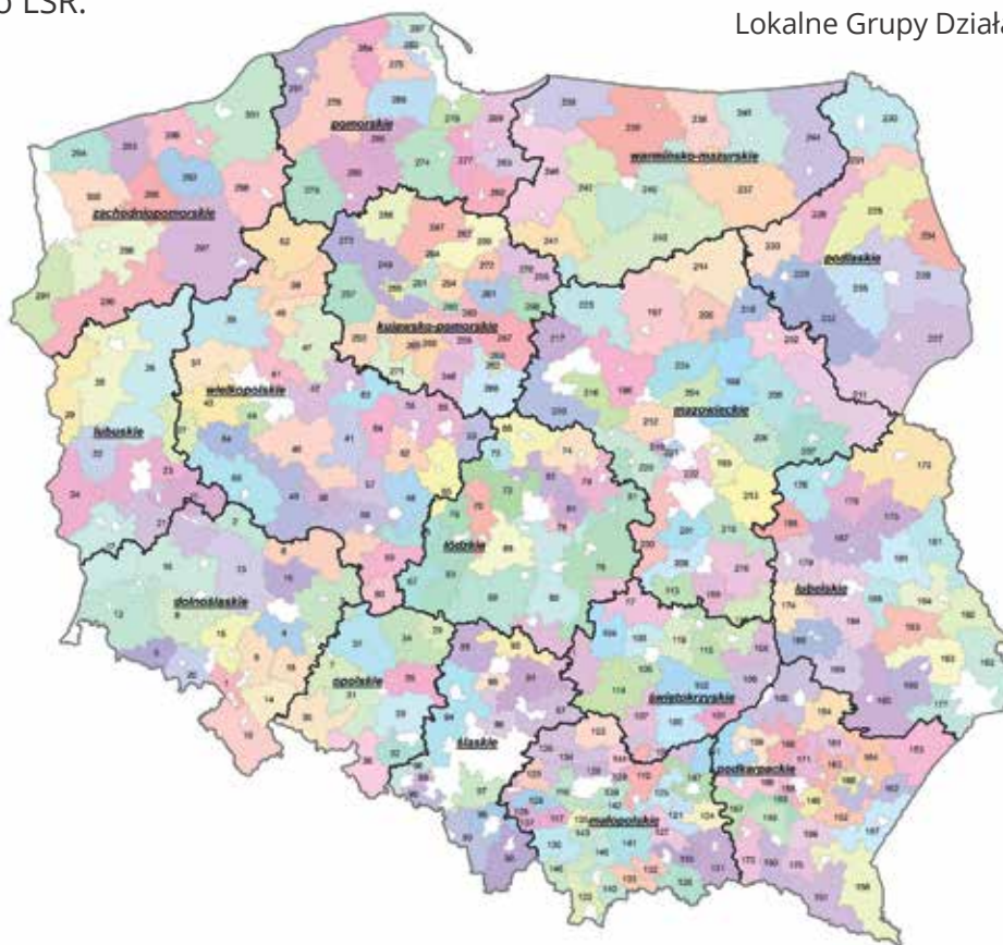
Lokalne Grupy Działania 2014–2020

LGD, których LSR zostały wybrane do realizacji i finansowania ze środków Programu.